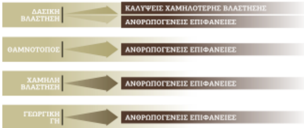
Σχήμα 1. Κύριες τάσεις δυσμενών μετατροπών στις καλύψεις της γης (η χρωματική ένταση αντιστοιχεί στην ένταση της πίεσης).